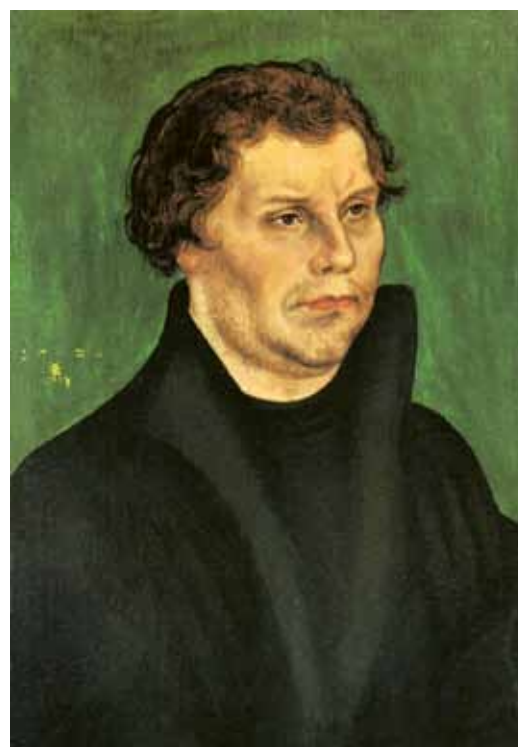
Martin Luther, ungdomsportrait. Udført af Lukas Cranach den ældre, ca. 1526