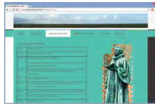
Hjemmesiden www.denyndigsterose.dk giver bl.a. et overblik over Brorsons liv og digtning